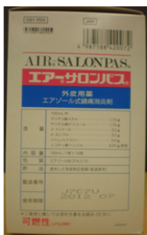
【中箱 - 変更前】